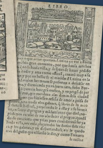
La città di Barcellona vista dalla porta del mare (Libro septimo, carta 230 v) e La città di Alghero vista dal mare (Libro quarto, carta 129 v), da Los Diez libros de fortuna de amor , Barcelona 1573 (BUCa, S.P. 6.10.44)